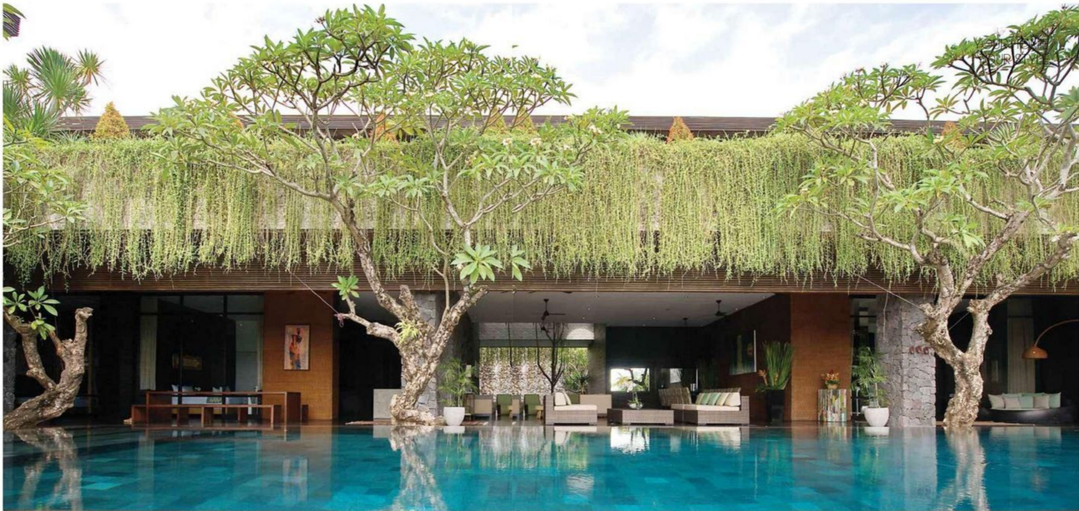
Inilah view paling indah, antara infinity pool, hijau tanaman dan fasad Villa Mana yang indah.